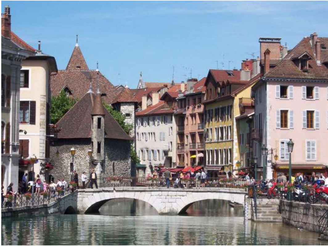
Vue du vieil Annecy