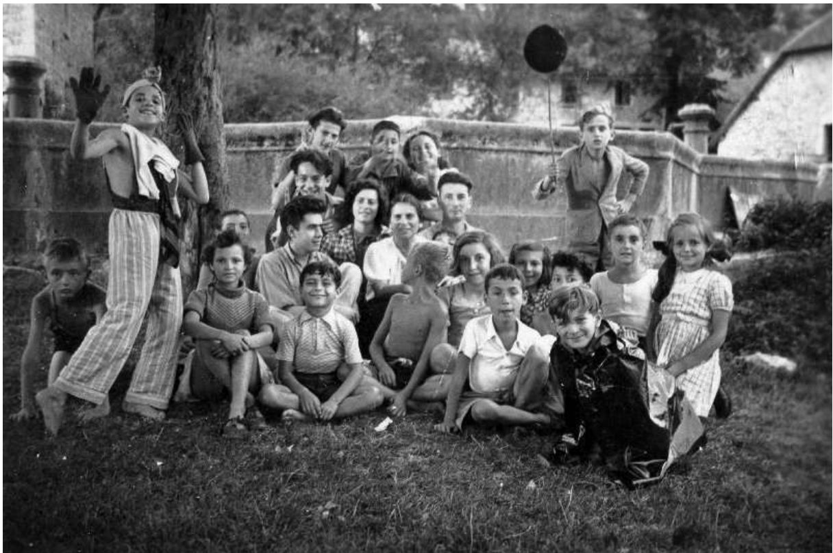
Les enfants d'Izieu en 1943

Malgré leur disparition, l'évocation de leur vie quotidienne donne au visiteur l'impression que leur absence n'est que temporaire et donne à réfléchir sur le sens de leur sacrifice.