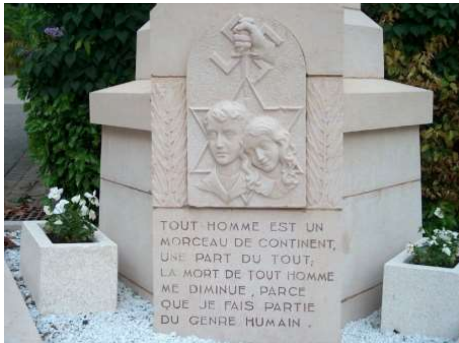
Inscription au bas du monument

http://www.memorialzieu.eu/decouvrir-le-memorial/