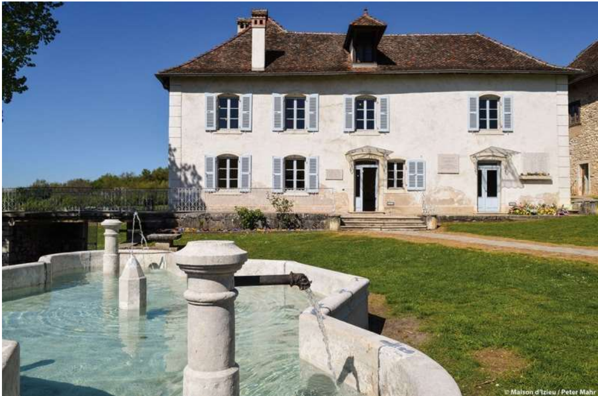
La Maison d'Izieu