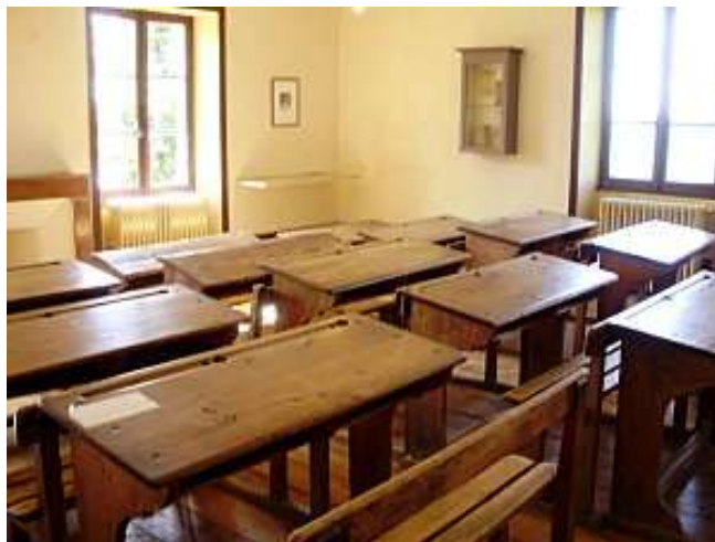
La salle de classe

La salle de classe avec les pupitres, les bancs et certains bulletins de notes a été reconstituée.