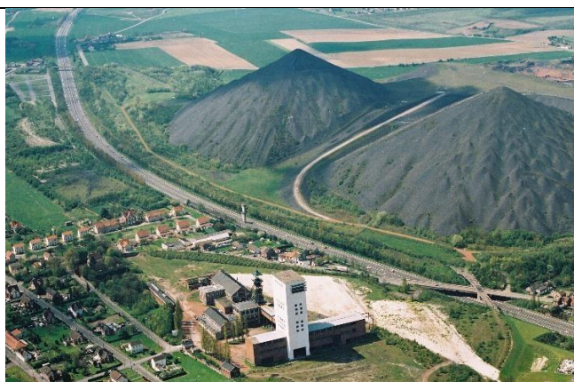
Ancien puits de mine dans le Nord