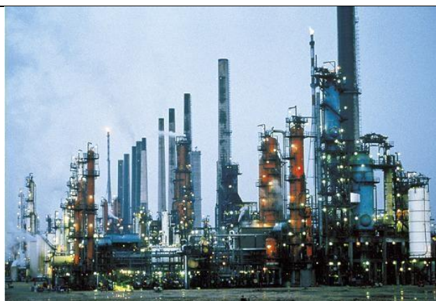
Raffinerie à Feyzin (région lyonnaise)