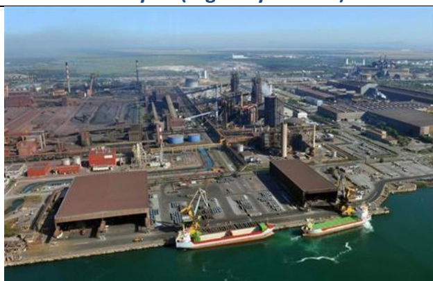
Zone industrialo-portuaire (ZIP) à Fos-Sur-Mer