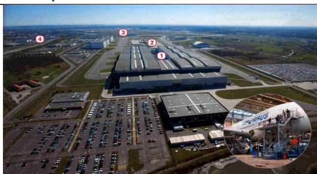
4 Le site Aéroconstellation à Toulouse 1 Usine d'assemblage de l'A380. 2 Aire d'essai des avions. 3 Aéroport de Toulouse-Blagnac. 4 Ville de Blagnac.