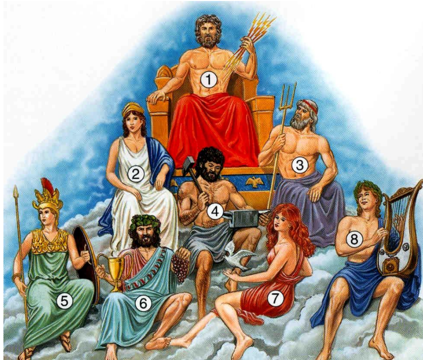
Les principaux dieux et les déesses grecques