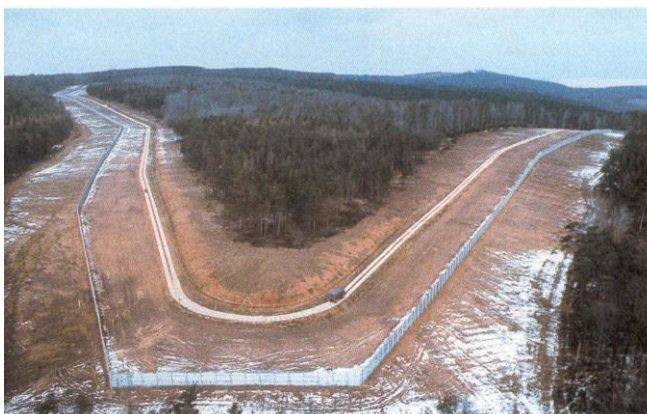
Une frontière entre Allemands : le rideau de fer entre la RFA et la RDA.

L'Europe et le Monde sont divisés en deux blocs idéologique, politique, économique, militaire (Otan et Pacte de Varsovie) rivaux et séparés par le « rideau de fer » .