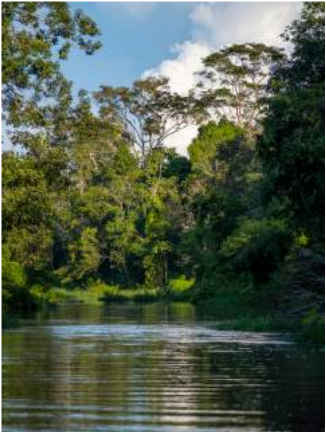
Paysage fluvial de l'Amazonie (Brésil).

« Pour vivre, vous devez respecter le monde : les arbres, les plantes, les animaux, les rivières et même la Terre elle-même. Nous respirons tous le même air, nous buvons tous la même eau. Nous vivons tous sur cette unique planète. Nous devons protéger la Terre. »